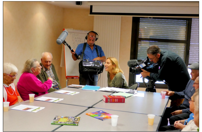
Septembre 2018, tournage d'un reportage par France 3 Bretagne