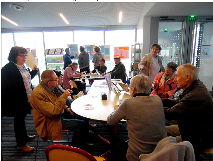
Septembre 2017, animation Journées du patrimoine à la médiathèque - Photo : Henri Couroussé ©