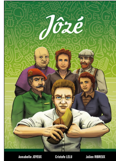
Jôzé, une bande dessinée de Cristofe Lelu

P ouint qemode de nâqhi poulet de hâe deden la campagne bertone.