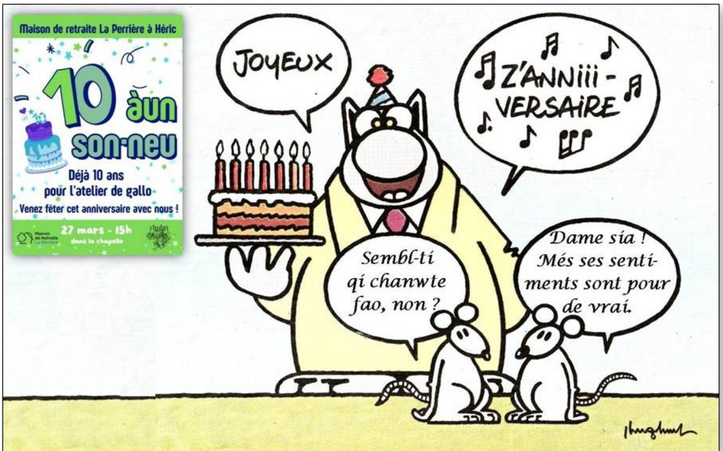
Illustration : Le chat de Philippe Geluck, texte gallo ajouté

Le 4 mars 2016 se tenait notre premier atelier de gallo. Le temps a passé vite, très vite même, l'atelier patois est devenu la fezerie galo et il a connu beaucoup de beaux événements. Mars 2026 a donc pour nous une saveur particulière, car c'est notre 10 e anniversaire. Ce vendredi 27 mars, nous avons vécu un bel après-midi festif, avec des ami.e.s conteurs, lecteurs et musicienne et des mini-conférences. Cette « banie espediale jou de néssance » de La Rotte retrace cet événement.