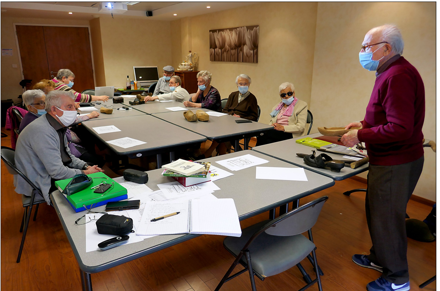
Mai 2021, venue de Pierre Aubry pour un atelier consacré à la fabrication des sabots